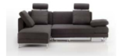
Bekannte Personen bekennen sich zu ihrem Lieblingsstück. Seiten 32-35