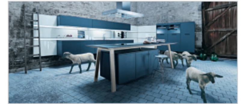
1A-KÜCHE KÖCHENSTUDIO SCHMID: CONTUR KÜCHEN „Ich muss die Atmosphäre atmen“ Seiten 36-39