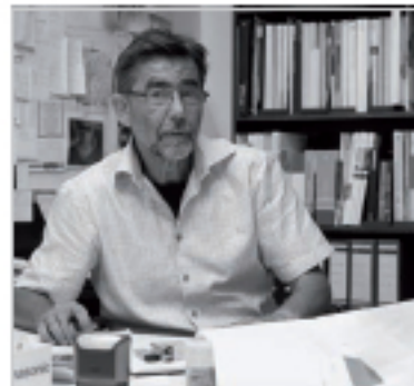
PETER LANG Lichtkultur aus Leidenschaft Seiten 28/29