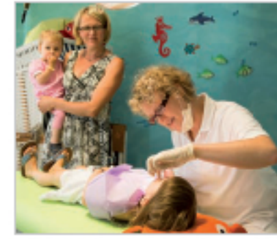
OPTIMALE ZAHNHEILKUNDE VON ANFANG AN