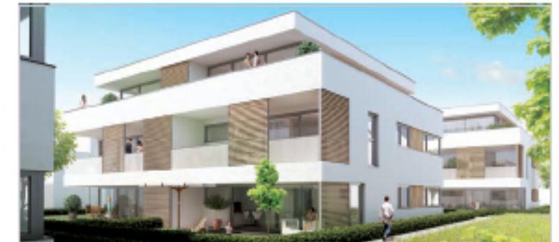
1A-WOHNEN DIE KREISBAU: WOHNEN MITTEN IN DER STADT Mehr als ein Hauch von Exklusivität Seiten 42/43