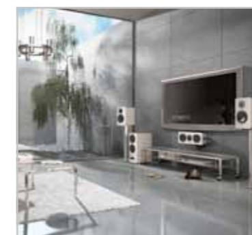
Nubert präsentiert nuVero Seiten 48/49