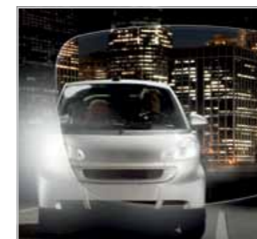
QUINTEN OPTIK/ I.PROFILER VON ZEISS Seiten 42/43