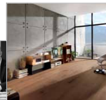
ALLMENDINGER/MAFI NATURHOLZBODEN GMBH Seiten 44/45