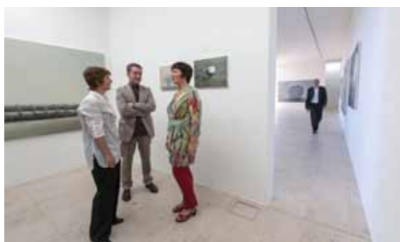
SÜDWESTGALERIE in Niederalfingen Ausstellungsräume umarmen die Kunst Seiten 34-37