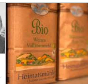
HEIMATSMÜHLE präsentiert das Mühlenlädle Seiten 50/51