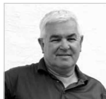
FRIEDRICH FILLAFER Die natürliche Kunst des Holzes trägt den Menschen Seiten 46/47